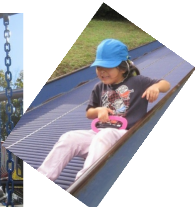
「うまさんにのってとうきょうまでいくよ」「すごいでしょ！ひとりでできたよ」「ヤッホー！はやくてぼうしがぬげちゃうよ…」「どんぐりのぼうしをゆびにつけたよ。ハロウィンのおばけみたいでしょ」「ゆらゆらばしだってこわくないよ」「みんなどいて！すごいスピードだったよ」一人ひとりが体をたくさん動かし、秋の自然に触れながら公園での遊びを満喫しました。