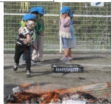
「やきゅうせんしゅみたいに…それ!」火の中に芋を投入。はじめは火まで届かなかったけれど、何度も行ううちに投げ方が上手になり命中「やったー!はいたよ」うれしそうな笑顔がたくさん見られました。「ひのちかくはあつかった。とおくからみるともやもやしている。けむりはくさい。めがいたくなる」などとたくさんの気付きもありました。