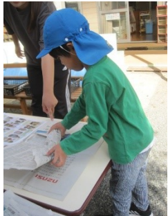
洗ったおいもには新聞紙の洋服を着せました。

31日(木) 焼きいもパーティーを行いました。前日まで天気が悪く、薪集めが思うようにできませんでしたが、近所の工務店からいただくことができ(ご協力ありがとうございました) 無事にお芋を焼くことができました。自分たちで苗を植え、収穫したお芋は最高!の味でした。