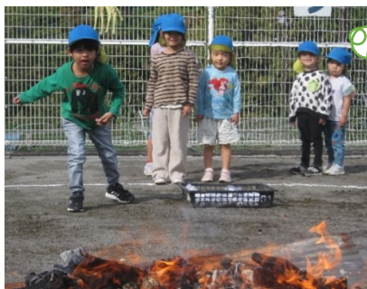
いくぞ!それ! 勢をつけてお芋を火の中心めがけて投入です。