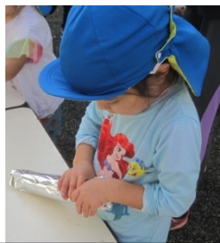
みんなの真似をして3歳児も自分で頑張りました。「ようぶくじゃなくてシャツだよ。そのあとかっこいいようぶくをきるんだからね」「ほら!かっこいいでしょ」