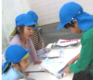
最後にかっこいい洋服(アルミホイルで巻きました)を着せました。