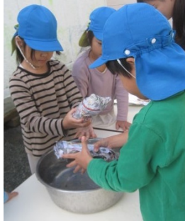
お風呂に入れます。