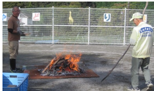
運転手さん・警備員さんの協力で実現できる活動です。ありがとうございます。