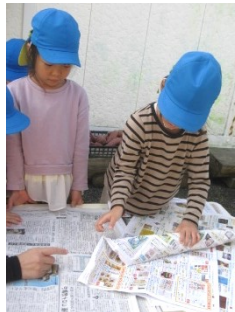
火が強いのでこげないようにもう1枚巻いていきます。