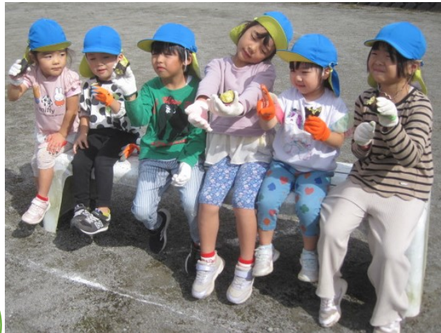
「やきいもおいしいね。あまいよ」「もっとたべたかった」みんなで食べたお芋とってもおいしかったね。お家の方にも食べてほしいという子どもたちの思いから1本ずつお土産に持ち帰りました。