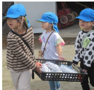
「うんしょ。うんしょ。がんばれ。がんばれ」「かっこいいようぶくをきたおいもだよ」