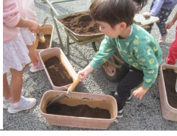
「どのくらいまでいれるの?」「うえのせんまでいれてね」「このくらいでどう?」「もうすこしかな…」友達と会話をしながらの作業です。