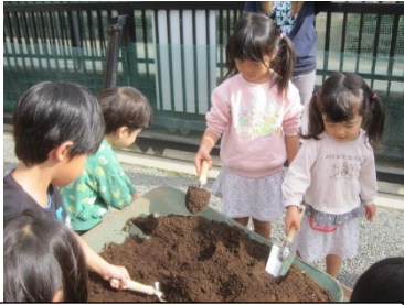
自分のプランターに土入れです。「たくさんすくっていれてね」年長児が見本を見せてくれました。

入園式にホールに飾るチューリップは、在園児から新入園児に向けての贈り物です。チューリップの球根うえをすると「新しいお友達がもうすぐ入ってくるね。楽しみだね」などという声が年長児から聞かれました。毎年恒例の活動で、チューリップが咲く頃にはみんな1つお兄さん・お姉さんになります。うれしくもありちょっと寂しくもある季節が少し近くなったことを感じる活動でした。