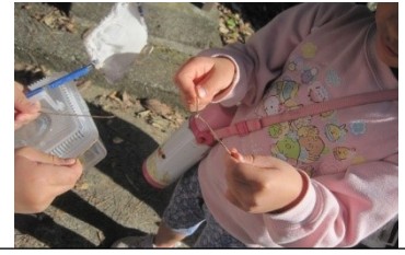
「どっちがつよいかな」松葉遊びを楽しみました。