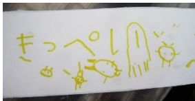
オリジナル看板の出来上がり!! 絵や文字を使って自分のことが分かるように表記しました。