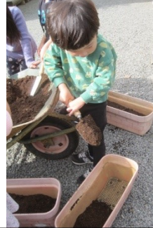
「シャベルカーだよ」見立て遊びをしながら楽しく作業を行いました。