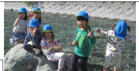
水の冷たさを感じ、夏とは違う川原を堪能しました。「やっぱりかわらがさいこう。またきたいね」川原大好き、やどっこたちです。