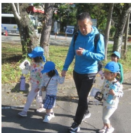
探検隊の隊長は…園長先生。「こっちだよ。おうちのちかくまでいこうよ」散策地域の子が案内役です。

天候に恵まれ久しぶりに地域探検に出かけました。今回の目的は『秋の自然物を見つけよう』です。まさに探検隊! 「こっちに行ってみよう」「あっちがいいよ」と…最終的に行きついた先は…大好きな川原でした。