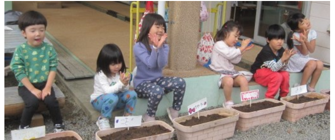
「はやくおおきくなーれ!」「かわいいチューリップ、はやくさくといいなあ…」「おみすまいにちあげないとね。チューリップさんものどかわいちゃうもね」開花を待ちわびる声が球根にも届いたことでしょう。