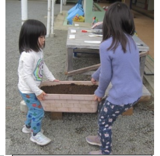
「おもたいの。てつだって」「いっしょにはこぼろう」協力して運びます。