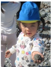
「どろだんごつくったよ」川原の砂でできました。