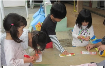
「これだれのだろう…わからないよね」とつぶやく声に「かんぱんつくろうよ」経験のある年長児がアイデアを出して看板製作が始まりました。